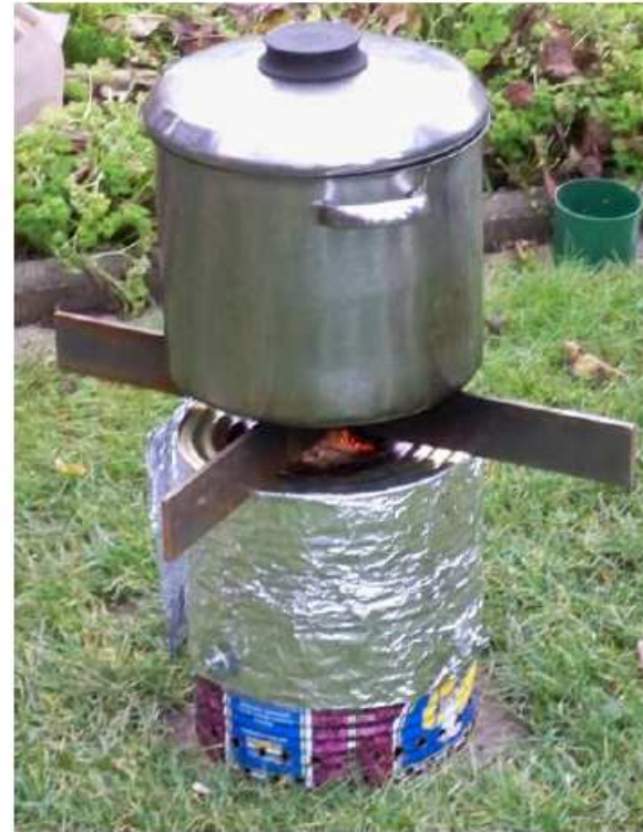
Sagawe & Sohn GbR Hameln